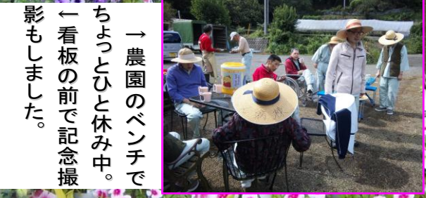
→ 農園のベンチでちよつとひと休み中。 ← 看板の前で記念撮影もしました。