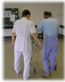
体力向上のために個人に合わせた訓練も行われている。(歩行訓練の様子↑)

精神科病棟とはいえ高齢になれば誰もが体に変調をきたしてきます。その症状も様々。腰痛などの各関節痛に始まり、病み上がりの方なら全身の筋力の衰え、新たに病気を発症される方も…。もちろん、どこも問題のない方も予防のために日ごろから体を動かすようお願いいたします。難しい体操ではなく、ゲームをしながら、歌を歌いながらでも大丈夫です。ほとんどの方は