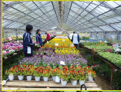
↑ビニールハウスでの買い物の様子。今の時期は花の種類も豊富。↓移動中の病院送迎バスの社内の様子。病院から園芸ランドまでは15分ほど。

皆で調理して、食べるのが今から楽しみです。次回の買出しは冬野菜の苗。九月頃を予定しています。